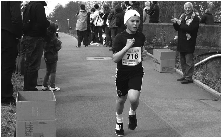
Der Vorstand feuert fleißig an