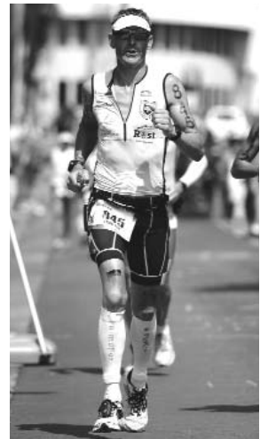
nun noch ein Marathon