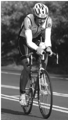
180 km radfahren